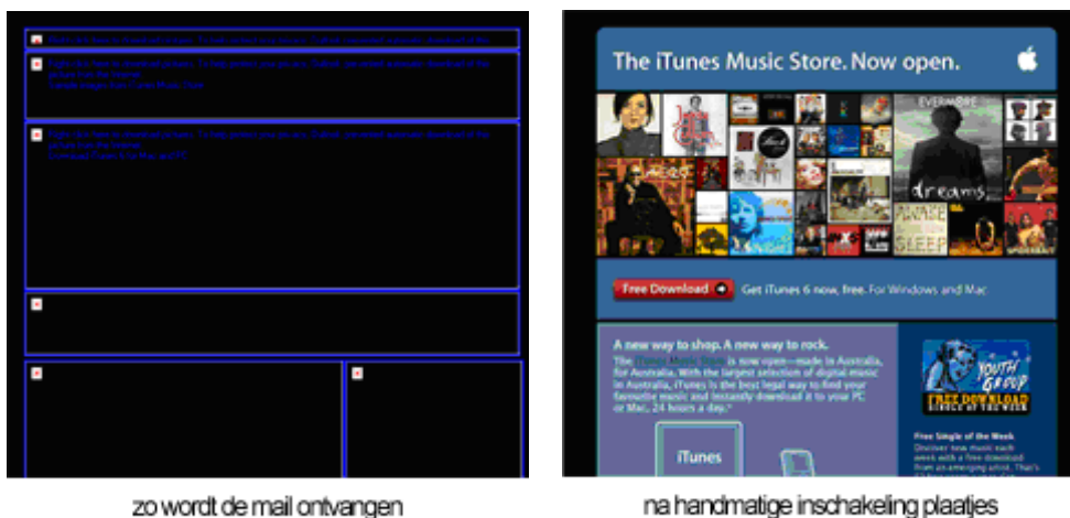
Figuur 2 en 3 Voorbeeld mail ontvangen en weergave na downloaden plaatjes

Als je bedenkt dat een groot deel van de ontvangers de linker variant ontvangt kun je je afvragen hoe effectief deze mailing is geweest. E-mails die uitsluitend uit afbeeldingen bestaan worden door veel gebruikers als "leeg" bericht ontvangen.