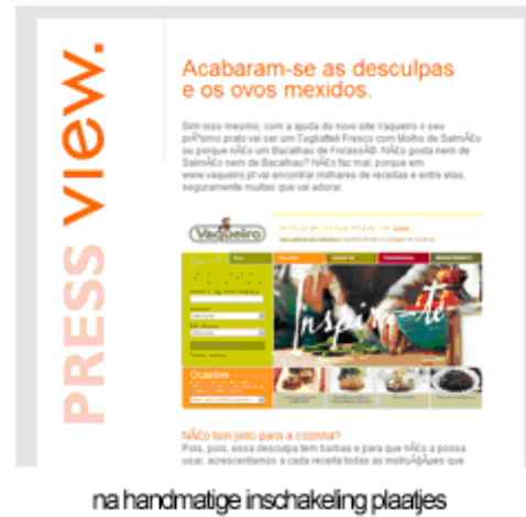
Figuur 4 en 5 Voorbeeld mail ontvangen en weergave na downloaden plaatjes